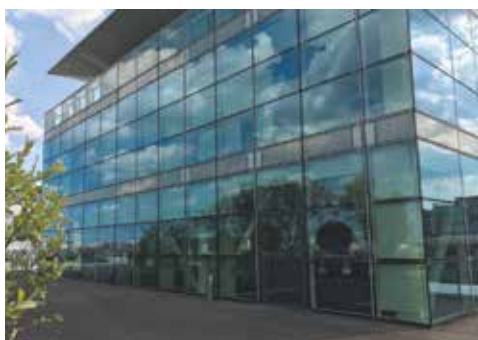
Siège social Procivis Paris 13 e

Leurs objectifs : favoriser les projets d'accès à la propriété, aider les ménages modestes et les copropriétés à mener à bien les projets de rénovation de leur logement. Les financements prennent la forme de prêts accession, de préfinancement des aides publiques et de prêts travaux pour le financement du reste à charge.